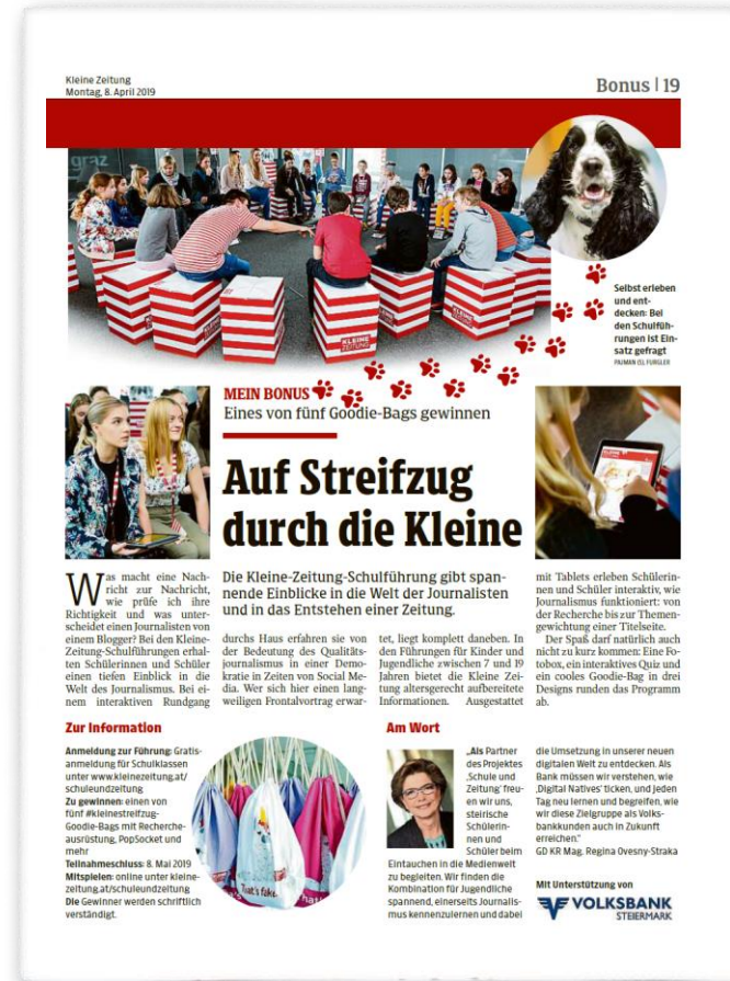
Beispiel redaktionelle Einbindung

Als Partner ist Ihr Logo auf all diesen Werbeformen vertreten und Sie somit mitten in der jungen Zielgruppe.